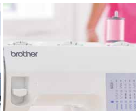
Enhebrado automático de aguja