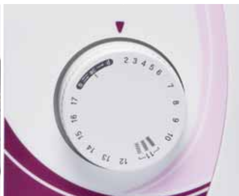
Selector de puntada