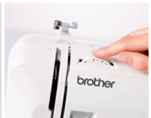
Ajuste de tensión

For more informations see your dealer or visit www.brothersewing.eu .